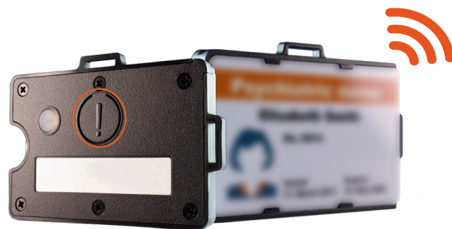
ZONITH BLUETOOTH ID-KORTHOLDER MED PANIKKNAP

Alle medarbejdere bærer en ZONITH ID-kortholder med deres adgangskort isat. ID-kortholderen har en diskret panikknop på bagsiden. Derudover er der fastmonteret trådløse panikknapper i både mødelokaler og receptionsområder. Disse panikknapper, kombineret med ZONITH's kontrolrumssoftware, giver medarbejderne et hurtigt og diskret panikalarmsystem som kan være med til at sikre hurtig assistance og undgå eskalerende og truende situationer.