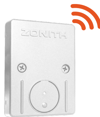
ZONITH PANIKKNAP TIL VÆG- OG BORDMONTERING